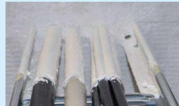
ПИРО-СЕЙФ ФЛАММОТЕКТ-А Шпаклевка

Консистенция «шпаклевки» успешно применяется для заделки больших отверстий и профильных швов. Благодаря своей консистенции, необходимая большая толщина нанесения достигается очень быстро.