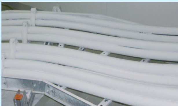
ПИРО-СЕЙФ ФЛАММОТЕКТ-А Краска

Консистенция «краски» оптимально пригодна для тонкослойного нанесения огнезащитного покрытия на кабели и кабельные несущие конструкции с целью предотвращения распространения горения в случае короткого замыкания или пожарной нагрузки снаружи, например, по CEI IEC 60 332-3 категория А.