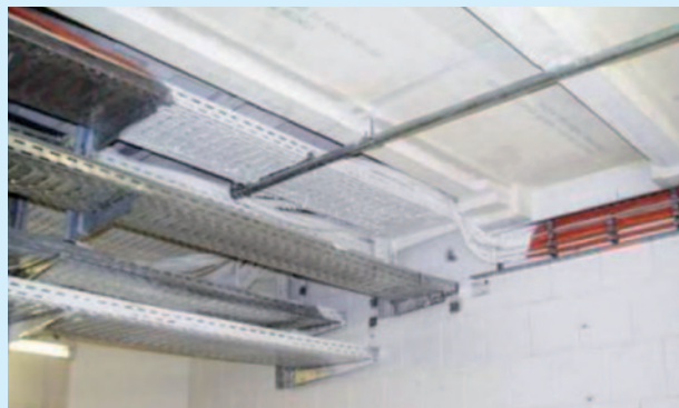
ПИРО-СЕЙФ ФЛАММОТЕКТ-А Густая краска

Толстослойное противопожарное покрытие для кабелей и кабельных несущих конструкций. Прогодно также для реализации проектов в соответствии с требованиями FM, предполагающие нанесение покрытия в 1 – 2 рабочие операции. Кроме того, «густая краска» особенно пригодна для применения в кабельных и комбинированных перегородках. И в добавление к этому, консистенция «густой краски» идеально подходит для покрытия минерально-волоконных плит и для потолочных работ.